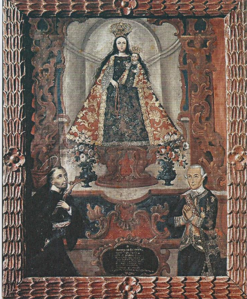
Areche, el verdugo. Los siglos jamás perdonarán sus crímenes.

Areche aparece ante la Virgen como orante, según figura en la cartela de la peana. La autora del libro encontró el cuadro en el Museo Histórico "Casa Inca Garcilaso" en 1971.