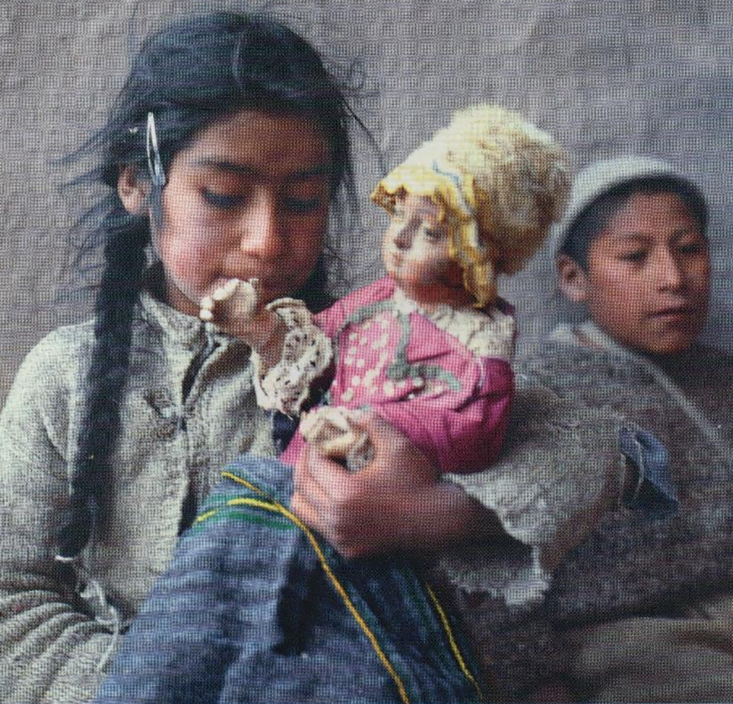
Niño Dios que Micaela habría llevado en brazos en los diciembre.

Foto testigo. Niña de Surimana muestra la pequeña imagen que sufrió descuido en los años pasados. 1969