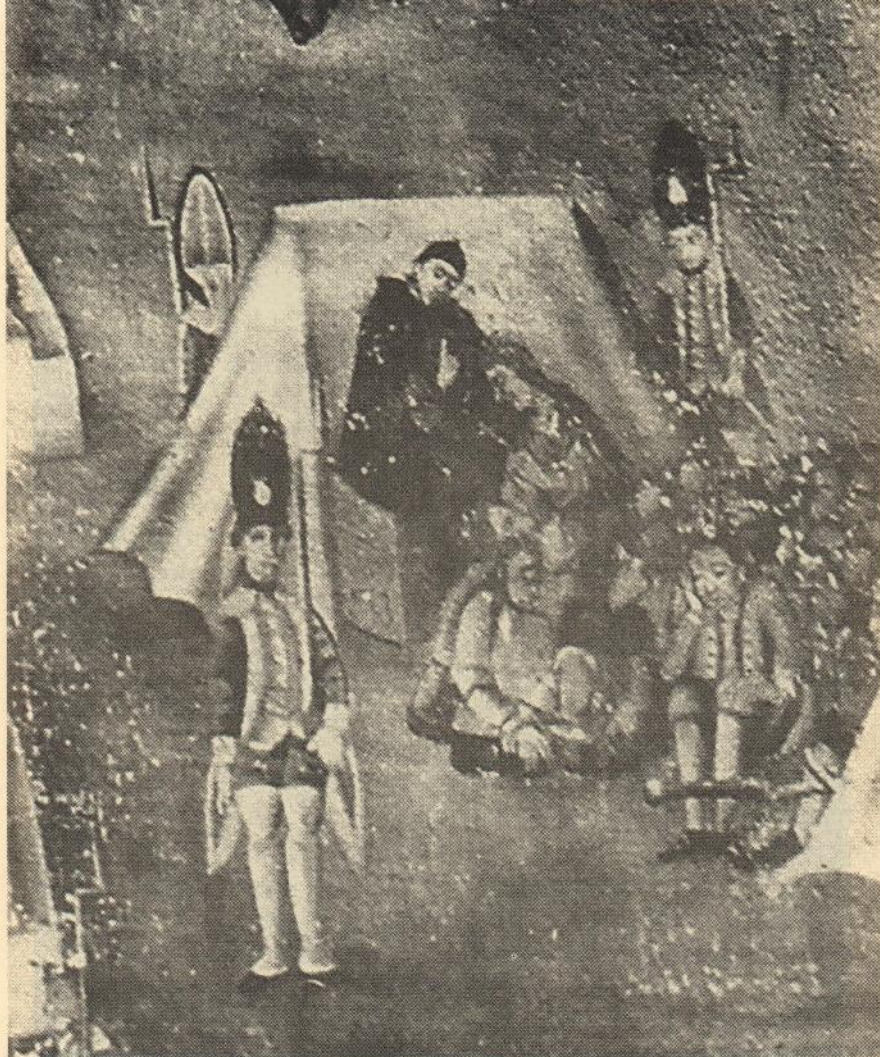
Tienda de campaña donde están sentados en el suelo y con grilletes José Gabriel, Micaela y Tomasa Titu Kondemayta.

Fragmento de la pintura que mandó hacer un devoto de la Virgen de las Nieves, agradecido por haberlo salvado de la muerte en la refriega de Tinta. Allí aparecen Tomasa Titu, Micaela y José Gabriel, después de su captura.