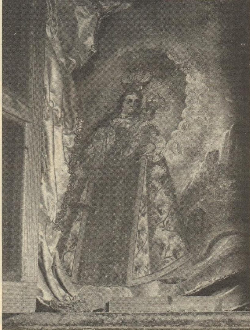
José Gabriel tuvo especial afecto por la Virgen del Carmen.

Manos ajenas sustrajeron de la sacristía de la iglesia de Surimana la Virgen pintada en una piedra de molino, con la alfombra de los Tupaq Amaru y el Niño Dios de Micaela.