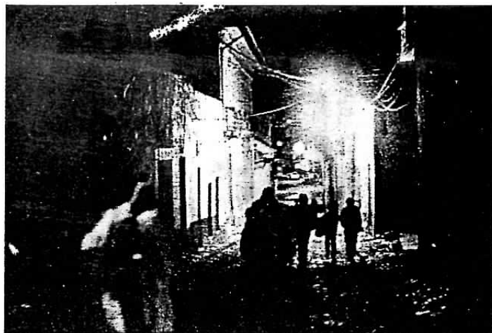
Calle Gral. Gonzáles, en la zona de San Pedro, La Paz.