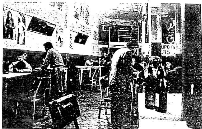
Durante la noche, cualquier compañía es buena.