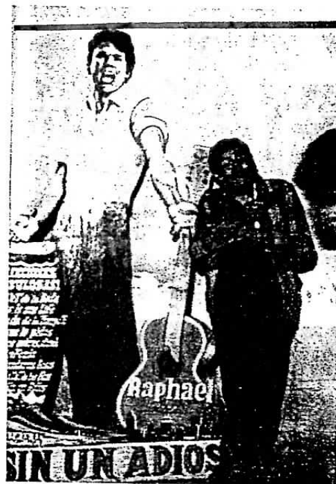
Cuidando el "agua de la vida".