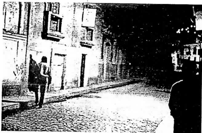
Callejuela en las cercanías del Cementerio General (La Paz).