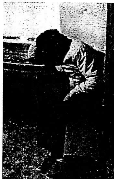
Esperando una nueva madrugada.