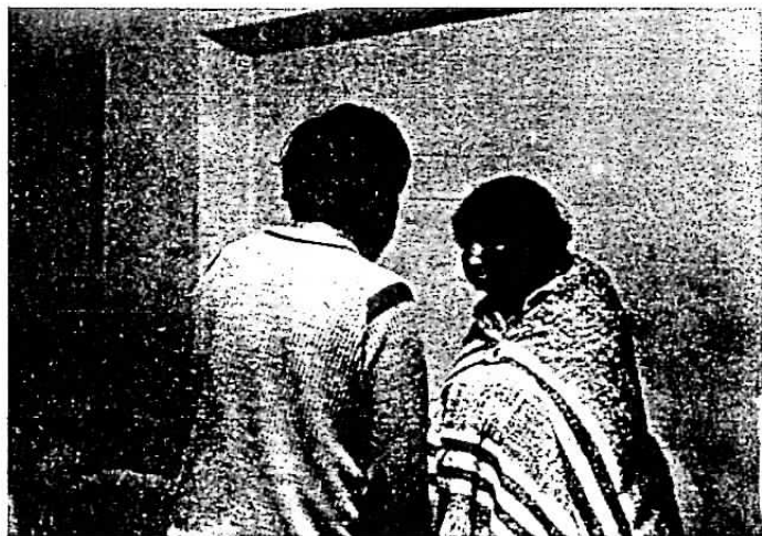
Pareja de habitantes de la noche paceña.